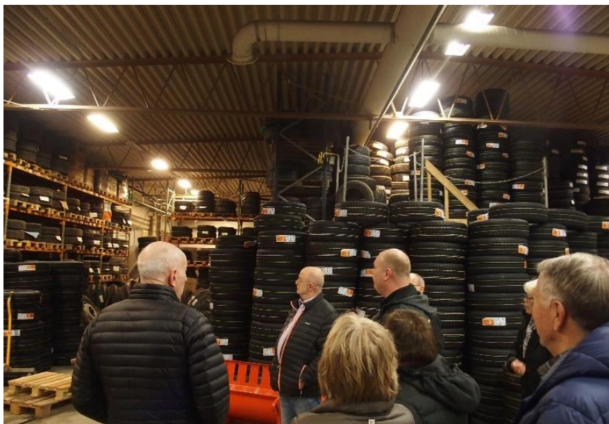
«Dekk Hotel» ser vi til venstre