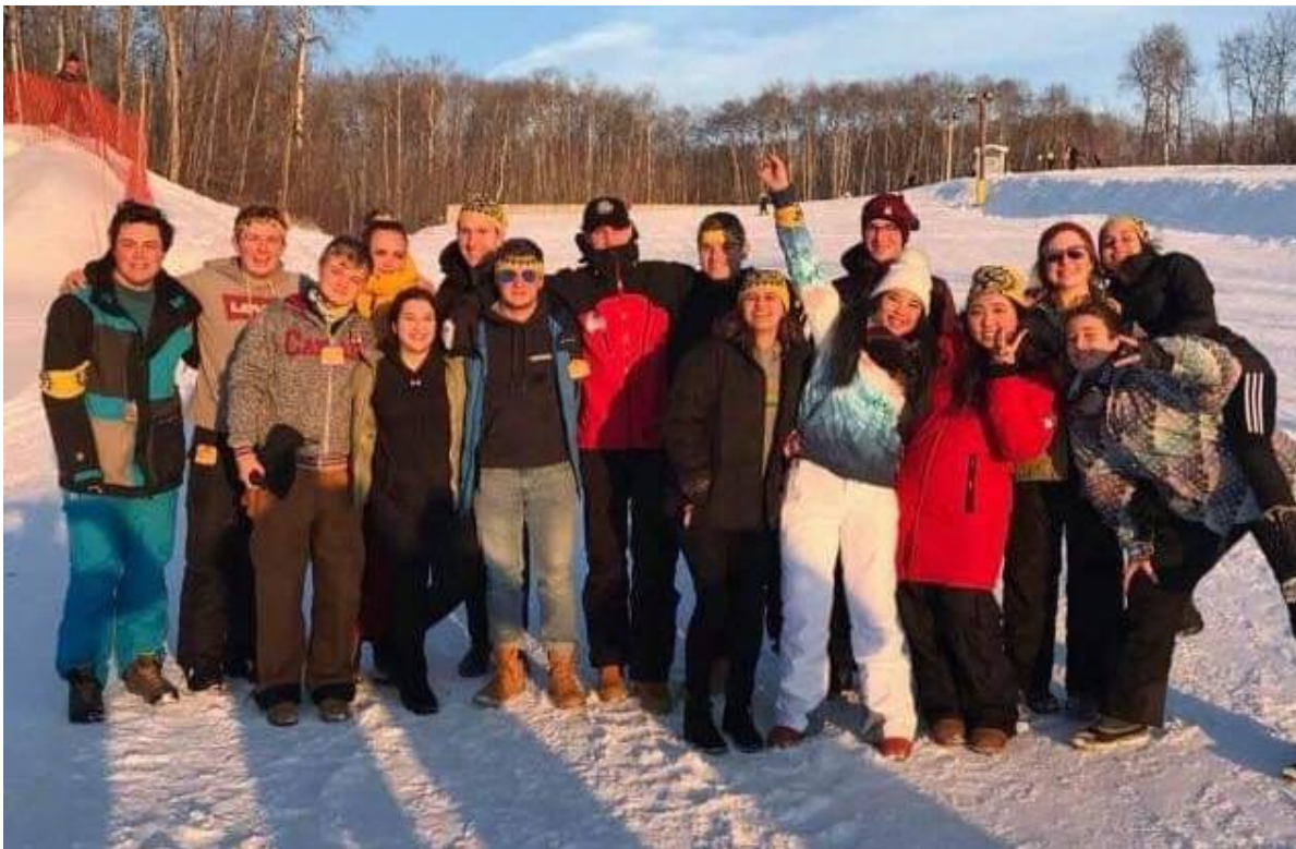
Sigvart nr. 3 fra venstre

Første semester hadde han matte-engelsk-drama. På fritida trener han ski og har også vært på curling.